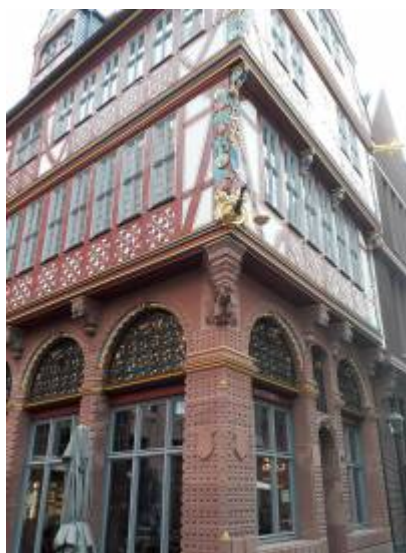
Abbildung 1: „Wir treffen uns vor der goldenen Waage“

From: https://foc.geomedienlabor.de/ - Frankfurt Open Courseware