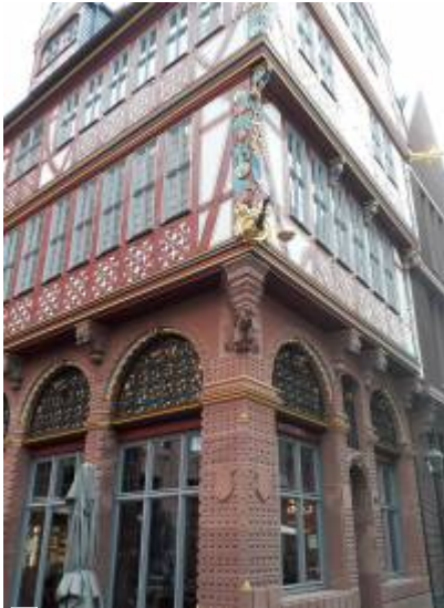
Abbildung 1: Verbale Beschreibung „Wir treffen uns vor der goldenen Waage“