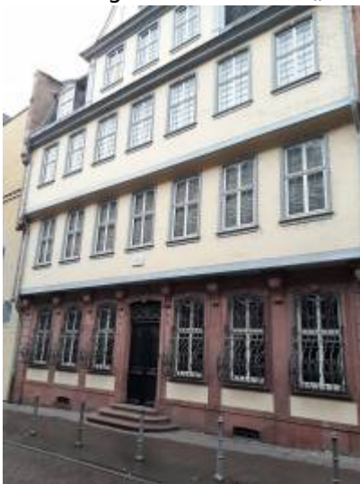
Abbildung 3: Adresse „Großer Hirschgraben 23-25, 60311 Frankfurt am Main“ eigene Aufnahme 2023