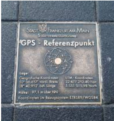
Abbildung 2: Koordinaten „50° 06,657' N 08° 40,912' E “ eigene Aufnahme 2023