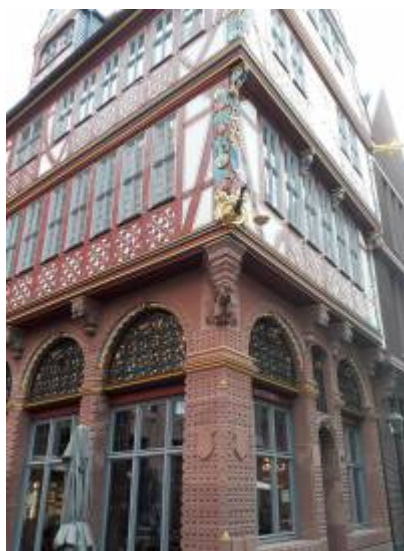
Abbildung 2: Verbale Beschreibung „Wir treffen uns vor der goldenen Waage“