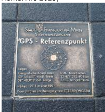
Abbildung 3: Koordinaten 50° 06,657' N 08° 40,912' E