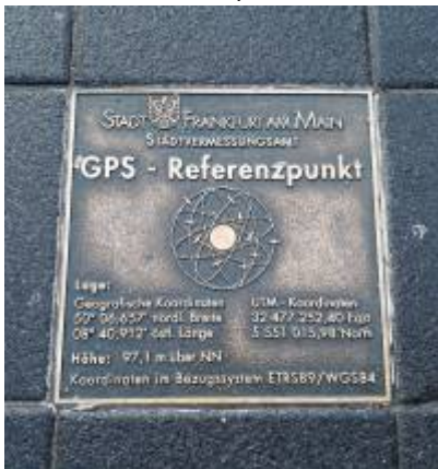
Abbildung 3: Koordinaten 50° 06,657' N 08° 40,912' E