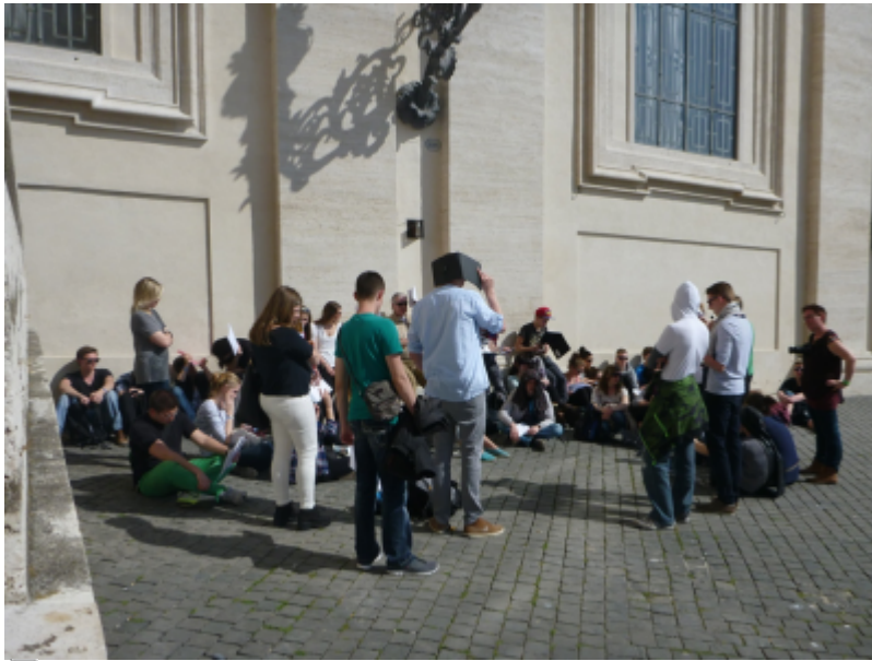
Abbildung 1: Ansprache vor dem Petersdom in Rom bei 24 Grad in der Sonne

Szenario: Am Rande des Petersplatzes vor dem Petersdom in Rom hat sich eine Gruppe junger Menschen in praller Sonne versammelt. Eine Person spricht zu der Gruppe, viele halten Papiermaterial in ihren Händen. Es handelt sich offensichtlich um eine Exkursion bzw. Studienfahrt, die genau diesen Standort auf dem Petersplatz als geeignet angesehen hat, um eine wohlfeile Ansprache im Gelände bzw. ein Referat zu halten. Die Gruppe hat sich im Halbkreis angeordnet und ist mit über 30 Personen unübersichtlich groß. Ein Großteil der Teilnehmenden sitzt auf dem Boden und verdeckt einander. Im Hintergrund unterhalten sich ein paar Teilnehmende. Wenig als ein Drittel setzt sich mit dem zur Verfügung stehenden Material auseinander. Einigen scheint es sinnvoller zu sein, es als Sonnenschutz zu nutzen. Insgesamt scheint die Gruppe wenig motiviert zu sein, der Ansprache zu folgen.