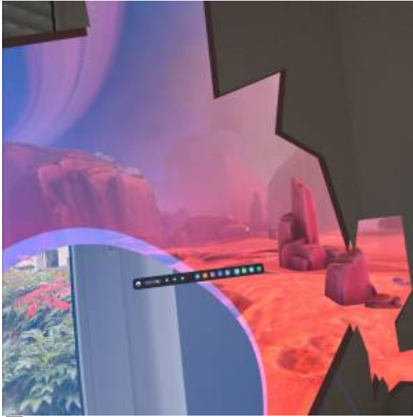
Abbildung 6: Aufnahme beim Überschreiten der Begrenzung

Begrenzungen können bei den Einstellungen unter Physischen Raum festgelegt oder bearbeitet werden.