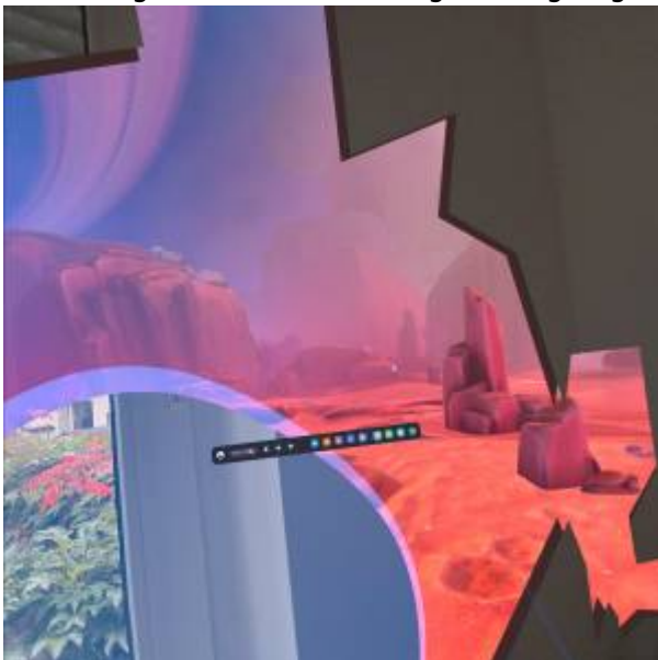
Abbildung 6: Aufnahme beim Überschreiten der Begrenzung; eigene Aufnahme

Begrenzungen können bei den Einstellungen unter Physischen Raum festgelegt oder bearbeitet werden.