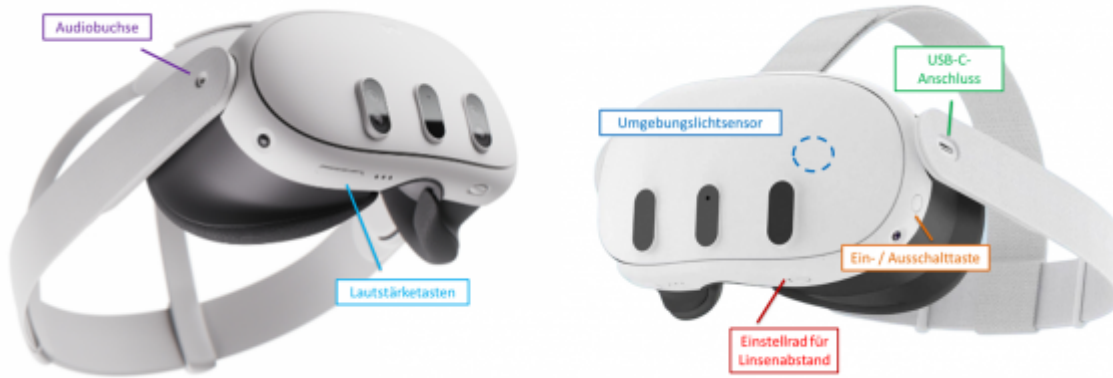
Abbildung 1: Aufbau des Headsets; eigene Darstellung verändert von links externe Verlinkung (10.10.2024) und rechts externe Verlinkung (10.10.2024)