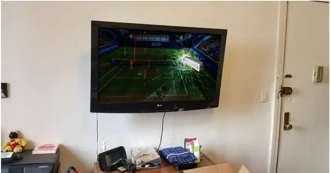
Abbildung 1: Controller-Unfall

Wir bitten Sie, bei der Nutzung der Controller die Handschleifen anzulegen . Dies dient nicht nur zur Sicherheit der Controller selbst, sondern auch zur Sicherheit Ihrer Umgebung.