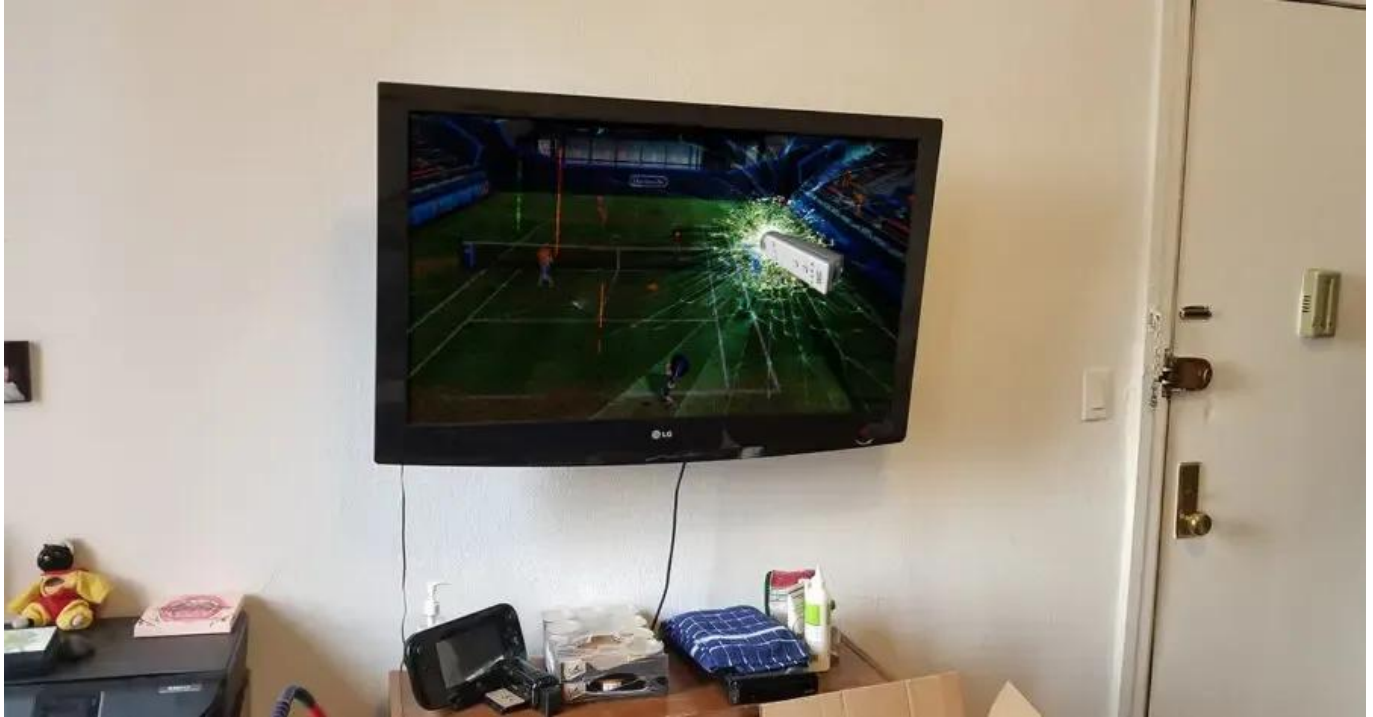
Abbildung 1: Controller-Unfall

Wir bitten Sie, bei der Nutzung der Controller die Handschleifen anzulegen . Dies dient nicht nur zur Sicherheit der Controller selbst, sondern auch zur Sicherheit Ihrer Umgebung.